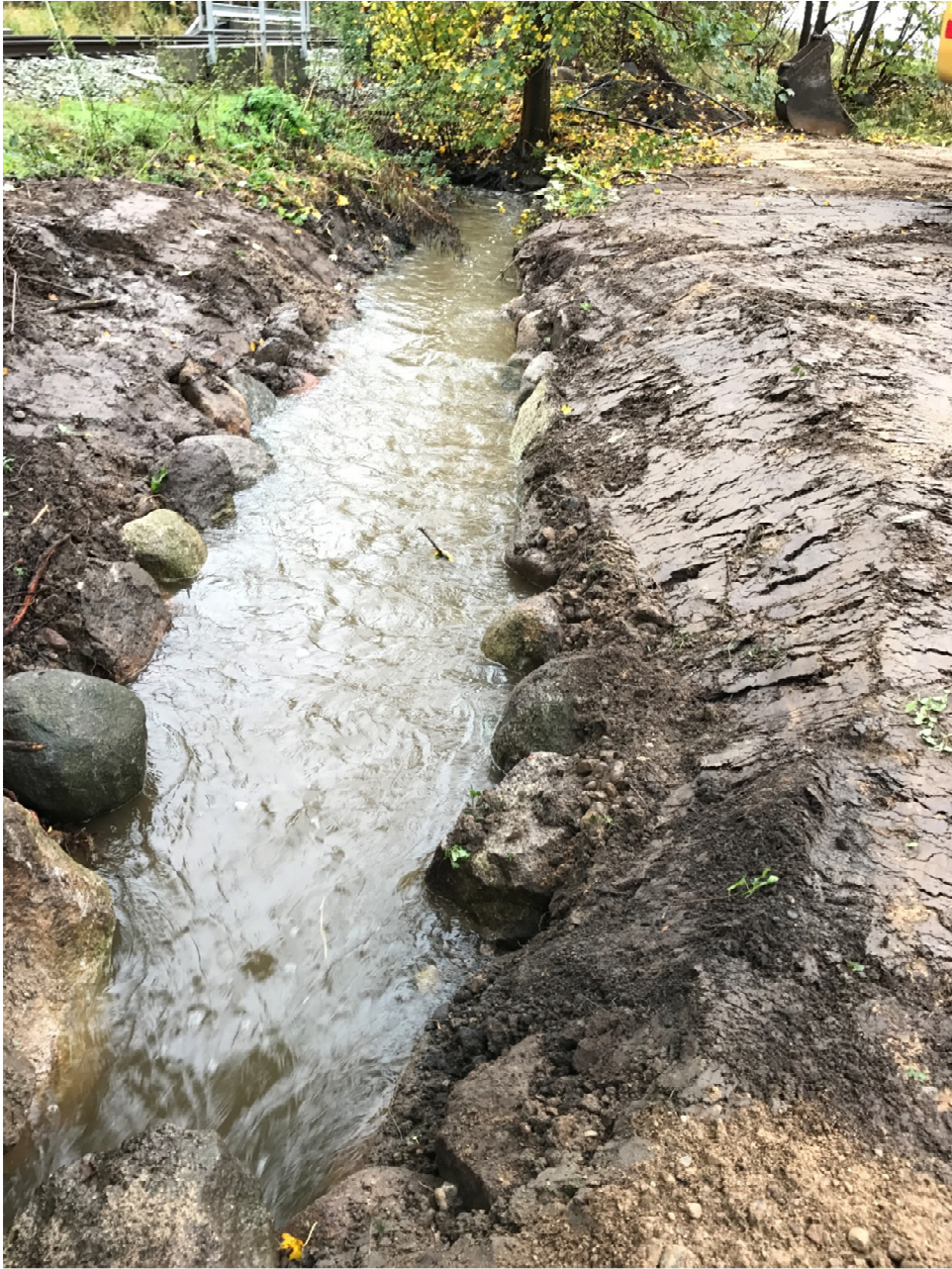
Nyetableret strækning med stensætning i siderne lige nedenstrøms jernbanen (jernbanen ses i baggrunden)