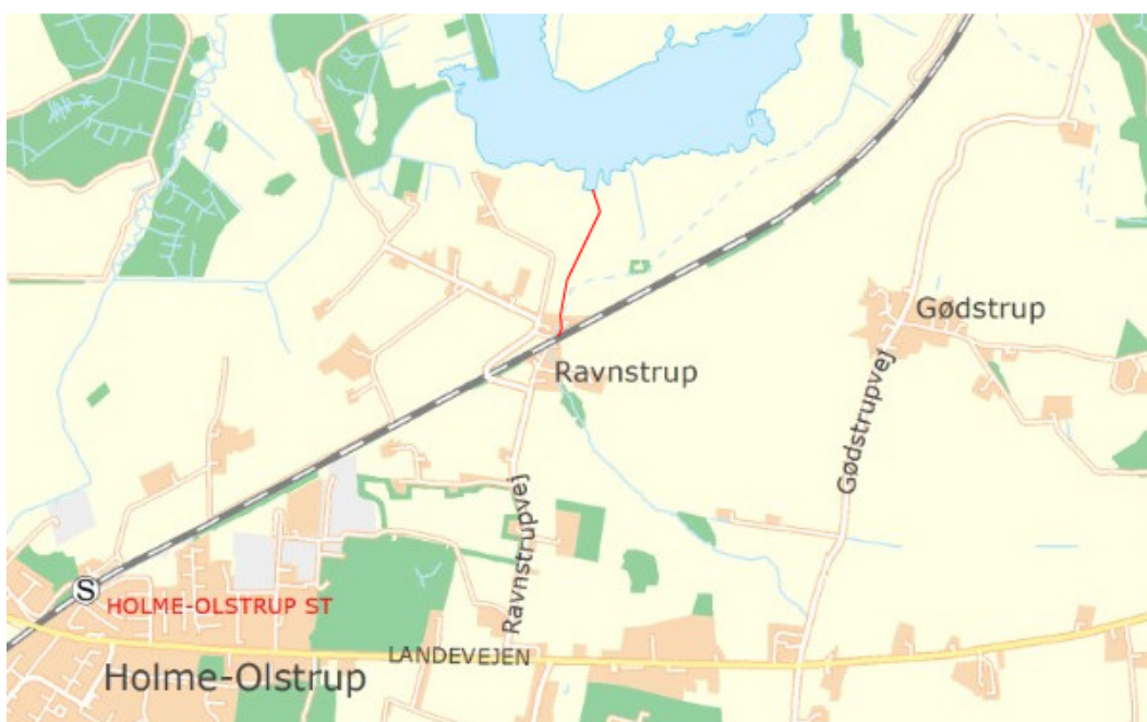
Kort over Tamosegrøften, projektstrækningen er markeret med rødt

Tamosegrøften er beliggende nordøst for Holme-Olstrup. Projektstrækningen løber fra landsbyen Ravnstrup til udløbet i Gødstrup Engsø.