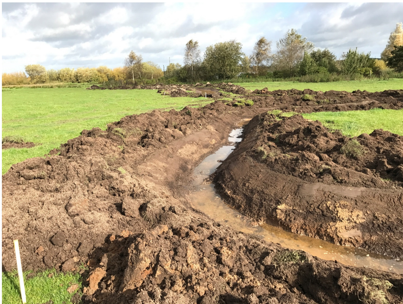
Udsigt over projektstrækningen